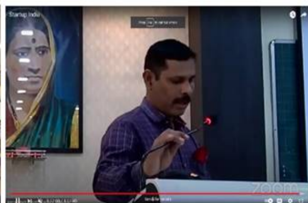
Photograph of IPR lecture: 28/02/2022, 11.00 Am- 2.00 Pm