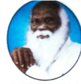
* FOUNDER * Padmabhushan Dr. Karmaveer Bhaurao Patil, D. Litt.

ID. No. - PU/PN/ASC/017/1966 A.I.S.H.E. - C - 41221