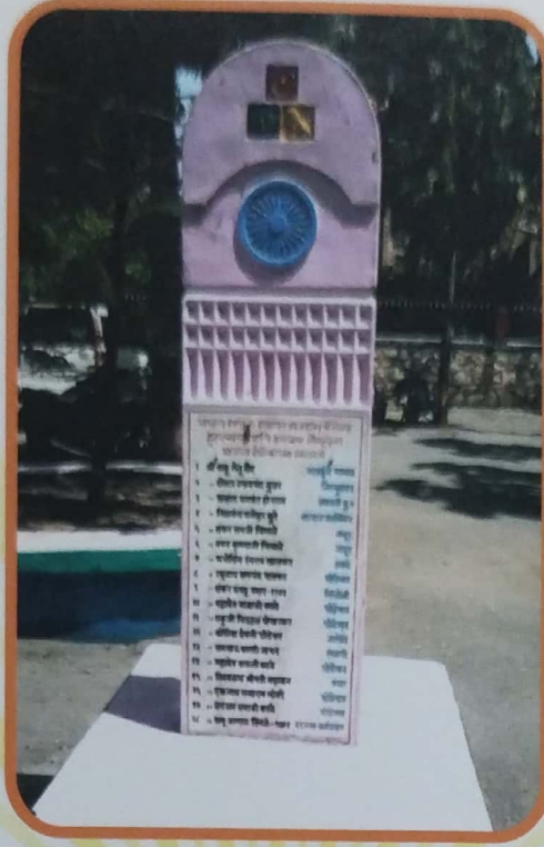
आंबेगाव तालुक्याच्या पंचायत समिती (घोडेगाव) कार्यालय येथील पटांगणात स्वातंत्र्य सैनिकांच्या स्मरणार्थ उभारलेला स्तंभ