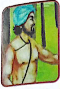
होन्या (होनाजी) केंगले