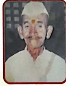
ववन कृष्णाजी चिखले